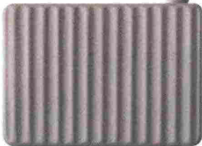
Applique "Umarèll" in ceramica opaca e sorgente LED KARMAN.