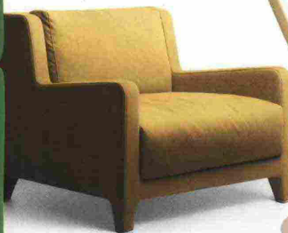
Poltrona comfort "Alma", sagomata in stile anni Quaranta LEMA.