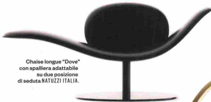
Chaise longue "Dove" con spalliera adattabile su due posizioni di seduta NATUZZI ITALIA.