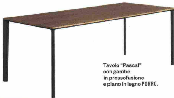
Tavolo "Pascal" con gambe in pressofusione e piano in legno PORRO.