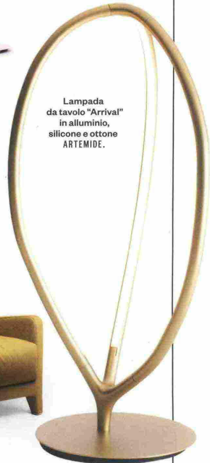
Lampada da tavolo "Arrival" in alluminio, silicone e ottone ARTEMIDE.